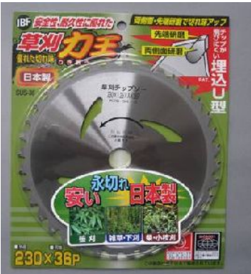
1. IBF草刈力王 軽量タイプ SUS-36K