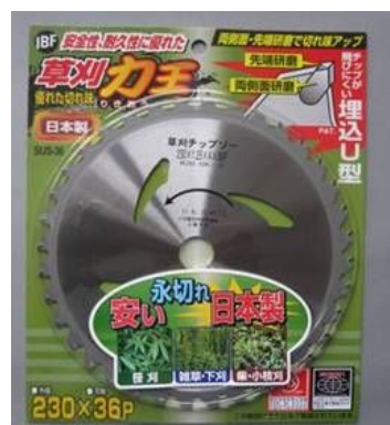
2. IBF草刈力王 軽量タイプ SUL-36K