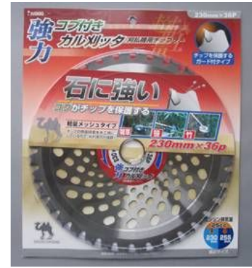
3. IW 強力コブ付カル刈ッタ 230 x 36P