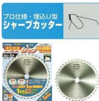
5. IBF シャープカッターU40 SPS-40