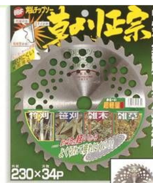
7. IBF 草刈正宗 SW-34