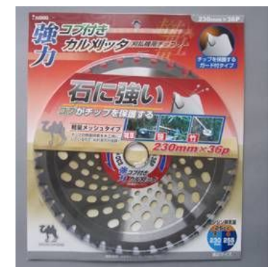
4. IW 強力コブ付カル刈ッタ 255 x 40P