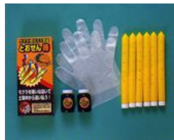
7. モグラ忌避材とおせん棒 6入れ