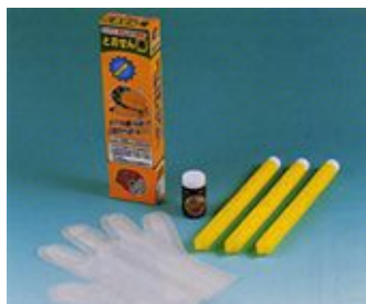
6. モグラ忌避材とおせん棒 3個入れ