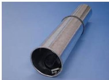
2. 万年 もぐら取り器 バラ