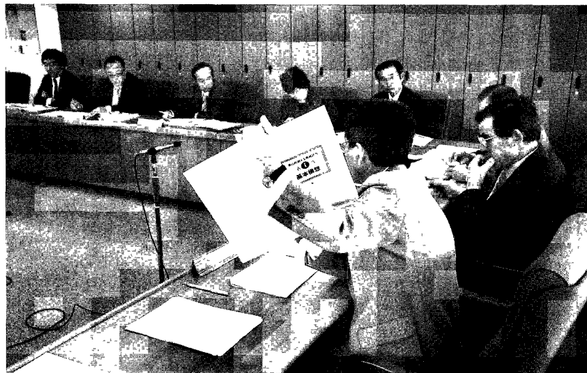
議会案を検討する議員全員による一般会議も3回におよんだ