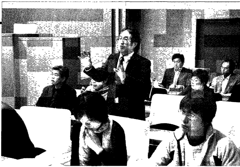
議会案に対して審議会委員から町長提案との相違点等多くの質疑が交わされた

合計画審議会委員24名、それに町長をはじめ執行機関8名（それにアドバイザー1名）が参加した。議員席に議員が、執行機関席に審議会委員と執行機関が座った。意見交換では、審議会での議論がむしろ議会修正案に近いことが明らかになった。このことはその後の経過を見ても了解できる。