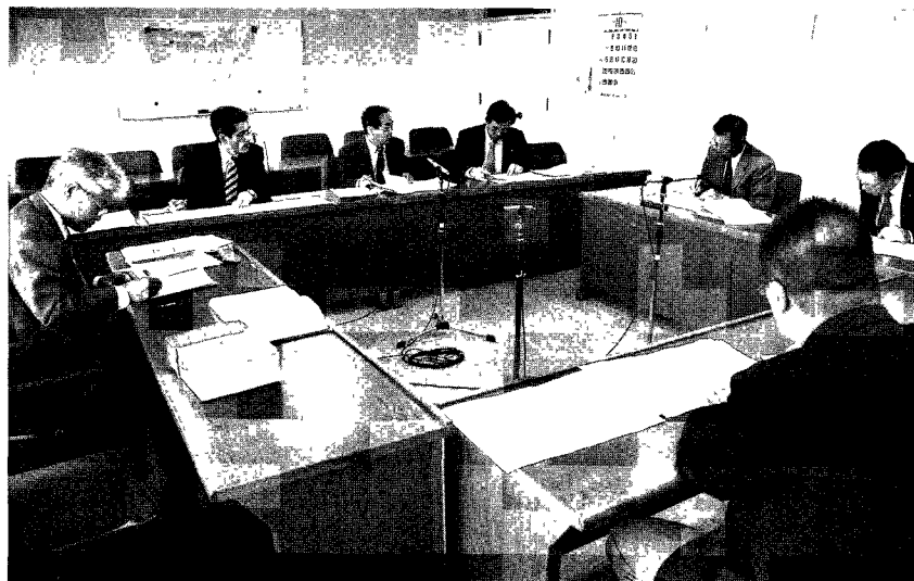
専門的知見を活用した議会素案策定委員会

(6) 江藤俊昭「住民自治における地方議会の役割―議論の風をコップの中から外へ―」『都市問題研究』2006年8月号、参照。