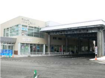
バスターミナル(事務所)棟